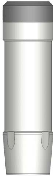
Inner Slip Type

· L-80 и P-110, а так же другие по заказу.